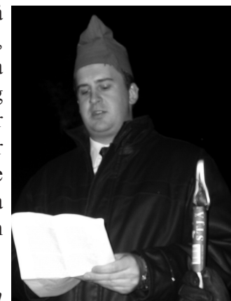
Br Blom håller Brandtal Julmotet 2003