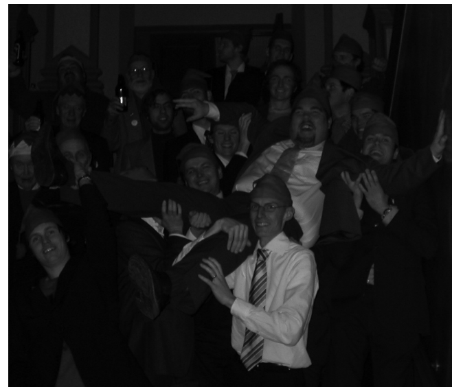
Att det finns tyngd bakom Storhaugens ord visar bröderna på Julmotet 2004

Ofta hörs på Mot, och annorstädes, den kända frasen "det var bättre förr". Bäst uttalas den av bittra föredettingar vars bitterhet dels består i avund över att yngre förmågor klarar av sitt uppdrag – i många fall bättre än en själv – dels i själva det faktum att de inte längre har någon reell funktion att fylla. Var det då bättre förr eller finns det allttjämt krut i nittioåringen?