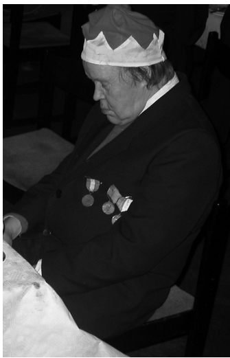
Artikelförfattaren på Julmot 2004

repriserade en halvsula Ljunglöv och med näbben full marcherade jag på lätta fjät in bland nasarnas och månglarnas alla stånd av skabbade råvskinn, hopsnurrade oxsvansar och pillgrimmade knivskaft, allt på jakt