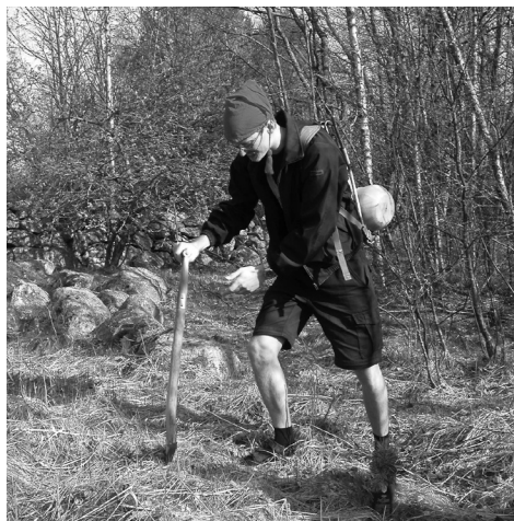
Inplantering av tallplant från Jamtland på Svartlöga.

Enligt många bröder verksamhets-årets kanske trivsammaste Mot - Ömotet på br Stj Sandlers sommarställe på ön Svartlöga bjöd på fantastiskt väder och inplanteringen av tre jamtska tallplant på ön.