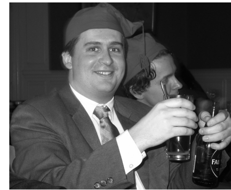
Br Blom med både Heitvasskask och Öl. I bakgrunden br Hed.

Malört-öl Dito - item mot hufvudvärk, Gulsot, Vattusot, och förstoppelsen.